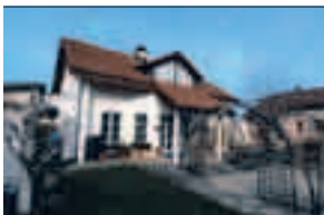
Niederlenz, Hammerweg 2

10 Gehminuten zum Bahnhof SBB, 2 Gehminuten zu Einkaufsmöglichkeiten, gepflegtes, freistehendes 5½-Zimmer-Einfamilienhaus , mit Sicht auf das Schloss Lenzburg, angenehme Wohnatmosphäre mit Cheminée, moderne Wohn-Essküche, charmante Zimmer mit Dachschrägen, Autounterstand und 2 Abstellplätze, Parzelle 632 m 2 , SIA-Kubatur 910 m 3