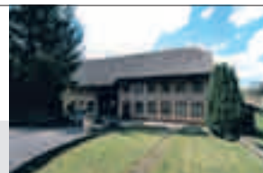
Gontenschwil, Geissenkragen 155

Mitten im Grünen, naturnahes, ruhiges Wohnen, freistehendes 6-Zimmer-Bauernhaus mit Scheune , ideal für Hundezucht (Zwinger vorhanden) oder Tierhaltung, eigener Brunnen, Parzelle 1991 m 2