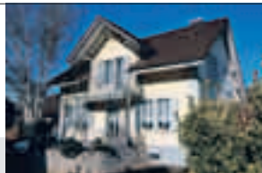
Rapperswil AG, Aarestrasse 10

Im steuergünstigen (95%) Rapperswil, freistehendes 6½-Zimmer-Einfamilienhaus Mit Autounterstand und Abstellplatz, Nähe Schulen und Einkauf, 4 Gehminuten zum SBB Bahnhof, gemütlicher, gedeckter Sitzplatz mit Cheminée, Garten-Schopf, Parzelle 566 m 2 , Kubatur nach SIA 1065 m 3 , Bruttogeschossfläche ca. 191 m 2 , Nettowohnfläche ca. 144 m 2 , Baujahr 1905/1980