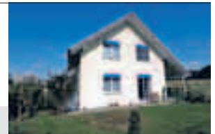
Rohr/Aarau AG, Grubenweg 2

Gepflegtes, freistehendes 4½-Zimmer-Einfamilienhaus mit Autounterstand, Reduit und Abstellplatz, grosszügiges Wohnen mit Schwedenofen, heimeliges Stübli im UG, gedeckter Sitzplatz, Parzelle 450 m 2 , Kubatur nach SIA 716 m 3 , Baujahr 2002