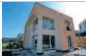
Sarmenstorf, Grubenweg 7

Nähe Hallwilersee, freistehendes neues 5½-Zimmer-Einfamilienhaus im Grünen. Ruhige Lage ohne Durchgangsverkehr, ÖV, Einkauf und Schulen in wenigen Gehminuten erreichbar, umweltfreundliche Wärmepumpenheizung (Luft/Wasser), Doppelgarage, Parzelle 438 m 2 , Kubatur nach SIA 892 m 3 , Baujahr 2008. Übernahme nach Vereinbarung.