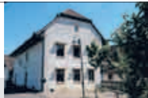
Schinznach-Dorf, Mühlegässli 8

Im alten Dorfkern, an ruhiger Lage, charmante, sehr gepflegte, 7½-Zimmer-Liegenschaft , freistehend, Massivholz-Wohn-/Ess-Küche, Bodenbeläge Parkett, Langriemen und Keramikplatten, Wärmepumpe, Sonnenkollektoren, Regenwasseranlage für WC-Spülung, Waschmaschine und Garten, Gewölbekeller, separate Gartenparzelle à 281 m 2 mit Schopf, Gartenhaus, Sitzplatz und zwei zusätzlichen Auto-Abstellplätzen, Baujahr zwischen 1750 und 1800, Nettofläche ca. 217 m 2 , Parzelle 210 m 2 und 281 m 2 , SIA-Kubatur 1529 m 3