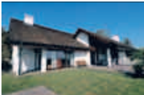
Beinwil am See, Bürgerheimstrasse 3

An sonniger, unverbaubarer Hanglage mit fantastischer Sicht auf den Hallwilersee und das Alpenpanorama, exklusive, stilvolle 7-Zimmer-Villa , sehr grosszügiger Wohn- und Essbereich, Cheminée-Ofen mit Wärmespeicher, Gartenanlage mit beheizbarem Aussenwhirlpool und antikem Brunnen, eigene kleine Quelle, Parzelle 1134 m 2 , SIA-Kubatur 2050 m 3 , Wohnfläche ca. 269 m 2