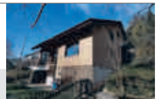
Erlinsbach (AG), Häsiweg 24

Freistehendes 5½-Zimmer-Einfamilienhaus , an sonniger Südhanglage, nahe der Stadtgrenze von Aarau. Wohnen mit Cheminée, Bodenbeläge Laminat und Platten, Whirlpool/Dampfbad, Parzelle 548 m 2 , SIA-Kubatur 923 m 3