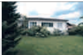
Buchs, Obere Torfeldstrasse 20

Nähe Aarauer Stadtgrenze und Spital, Bushaltestelle praktisch vor der Haustüre, gepflegte, freistehende 4½-Zimmer-Wohnliegenschaft , idyllische Gartenanlage, top-moderne Wohn-/Essküche, sehr angenehme Wohnatmosphäre, separater Carport und Schopf, Parzelle 1249 m 2 , SIA-Kubatur 756 m 3 , Baujahr 1941, vollständig saniert und renoviert 1998/99